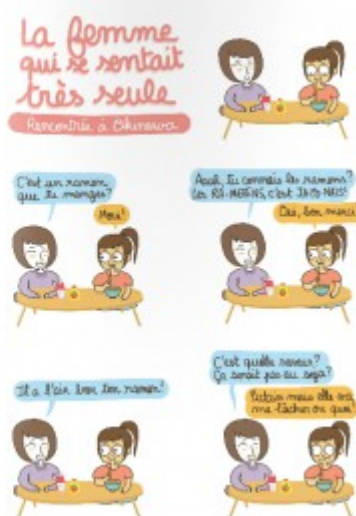
Ci-dessus : Un extrait du récit